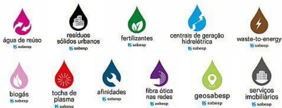
Quadro 2 – Sabesp: novas áreas de atuação