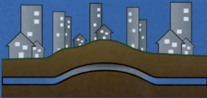
Ar na Rede