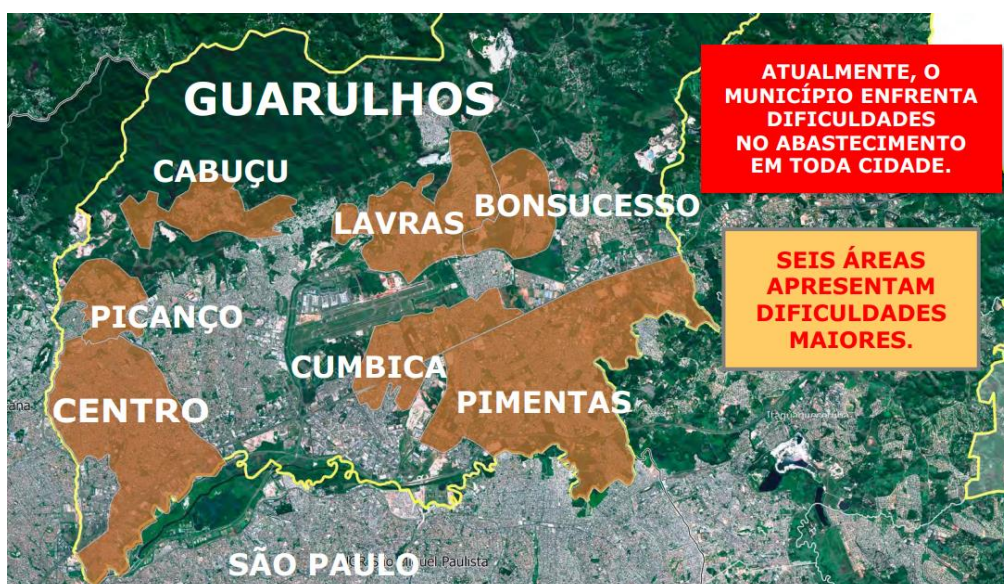
Quadro 1 – Guarulhos: regiões para melhora do abastecimento de água